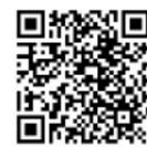
(実習（出講型）申込フォーム)